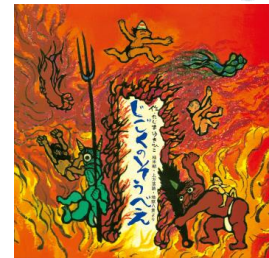
たじま ゆきひこ 作

「とざい、とうざい。かるわざしのそうべえ、一世一代のかるわざでござあい。」綱わたりの最中に、綱から落ちてしまった軽業師のそうべえ。気がつく、そこは地獄。火の車にのせられ、山伏のふっかい、歯ぬき師のしかい、医者のおちくあんと三途の川をわたってえんま大王の元へ。4人はふんによう地獄や、針の山、熱湯の釜になげこまれ、人を食べる人呑鬼にのみこまれます。そうべえたちははたして生き返ることができるのか、あとは読んでのお楽しみ。